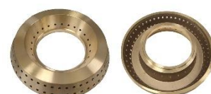
ESPALHADOR PRESMALT LATÃO