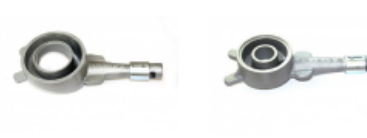
CACHIMBO MEIRELES FERRO FUNDIDO