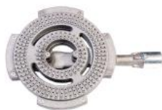
QUEIMADOR GIGANTE FERRO FUNDIDO