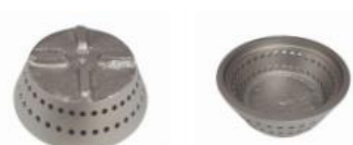
ESPALHADOR PRESMALT FERRO FECHADO