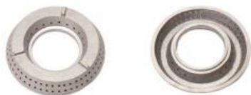
ESPALHADOR PRESMALT FERRO FUNDIDO