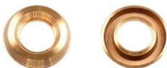
ESPALHADOR MEIRELES LATÃO S/ABA